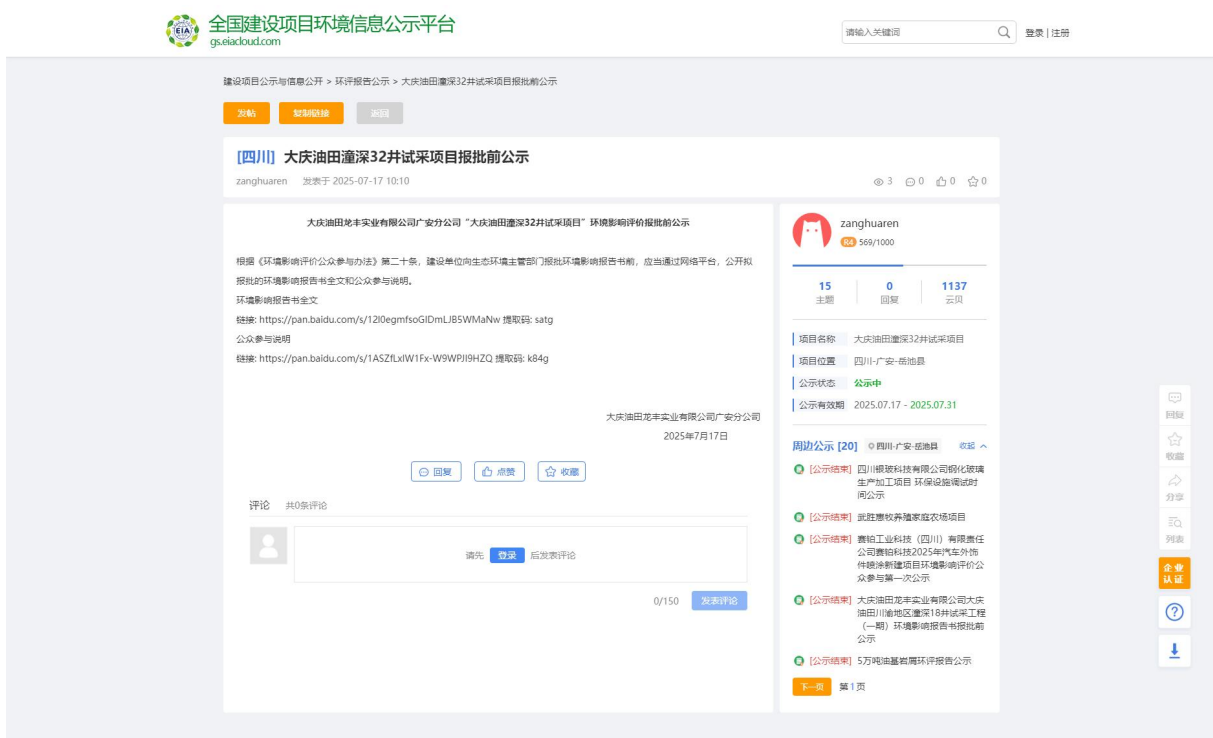
图 8 报批前公示截图

建设单位选取“全国建设项目环境信息公示平台”网站作为公示载体对项目环境影响报告书全文及公众参与说明进行公示，网络公示时间为 2025 年 7 月 17 日，网址为： https://www.eiacloud.com/gs/detail/1?id=50717v0Az9 ，报批前项目环境影响报告书全文及公众参与说明网上公示截图见下。