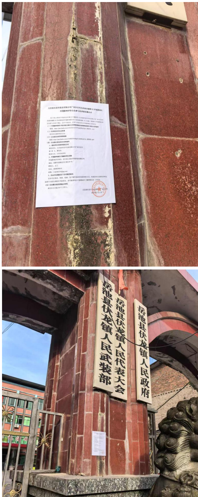
图 7 张贴公告照片