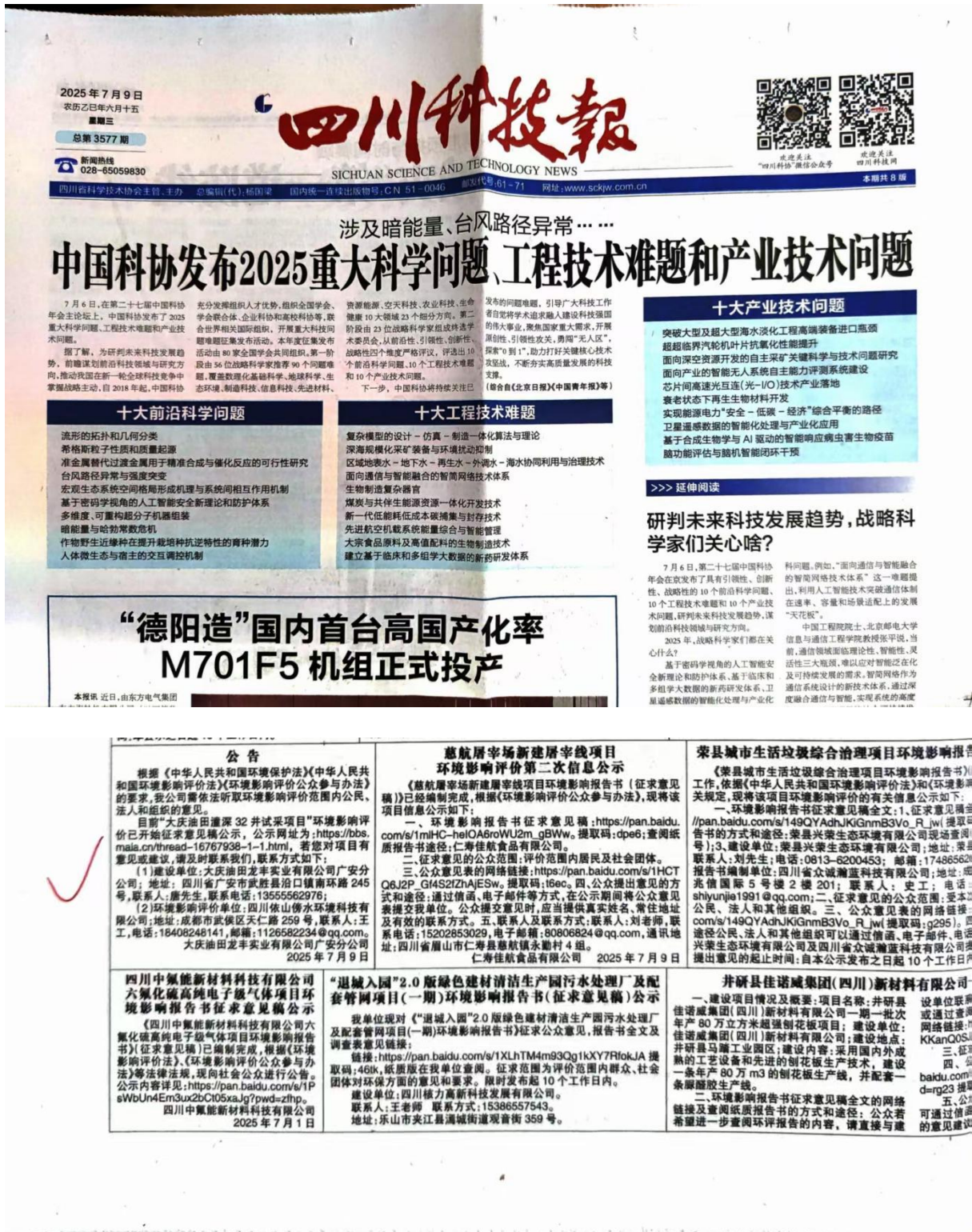
图 6 2025 年 7 月 9 日《四川科技报》报纸公示截图