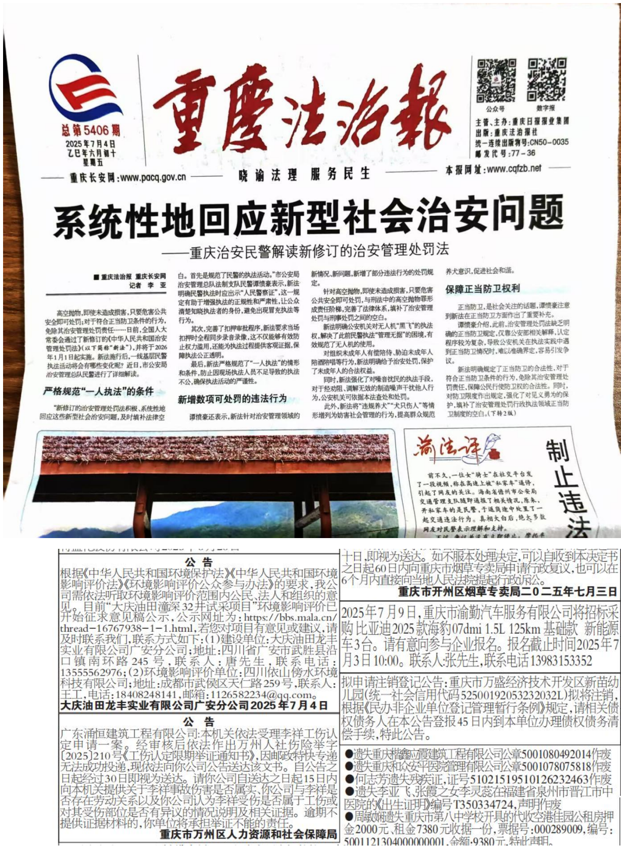
图 4 2025 年 7 月 4 日《重庆法治报》报纸公示截图